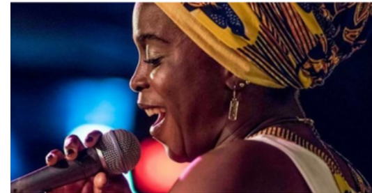
FACEBOOK/CARINE AU MICRO